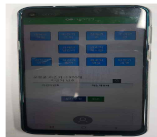
배송 업무 현장사진